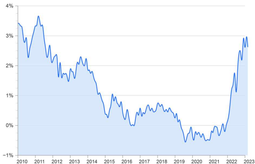
Grafiek 1: rente (10 jaar, obligatierendement)

Potentiële huizenkopers merken dat zij een minder hoge hypotheek kunnen afsluiten. Dit drukt de huizenprijzen. In het derde kwartaal van 2022 is die daling in Utrecht voor het eerst in de cijfers zichtbaar (zie grafiek 2 hieronder). Verkopers van bestaande woningen merken dat zij met minder winst genoeg moeten nemen. “Minder winst”, want sinds 2015 zijn de huizenprijzen in Utrecht meer dan verdubbeld. De prijzen zijn sneller gestegen dan het Nederlandse gemiddelde en zelfs sneller dan de huizenprijzen in Amsterdam.